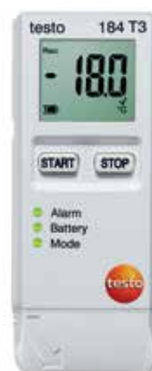
testo 184 T3