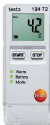
testo 184 T2